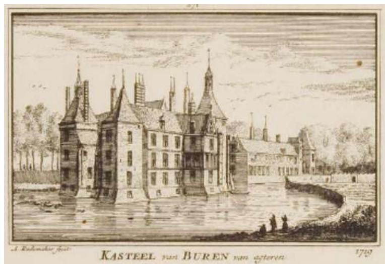
Kasteel van graafschap Buren 1719